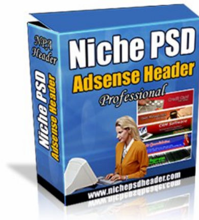
Pakej PSD Header

51 PSD Web Header khas untuk memudahkan anda membina grafik header untuk laman web anda. Anda dapat membina grafik web header yang professional dengan mudah dan cepat. Di samping itu, dapatkan bonus PERCUMA dari pakej PSD Web Header ini. Layari http://www.nichepsdheader.com