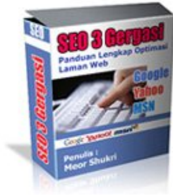
Pakej eBook SEO 3G

Ketahui rahsia bagaimana anda boleh senaraikan laman web anda ke dalam search engine Google, Yahoo dan MSN. Dapatkan panduan mudah SEO (Search Engine Optimization) tersebut di http://www.jomwebtemplate.com/ebookseo